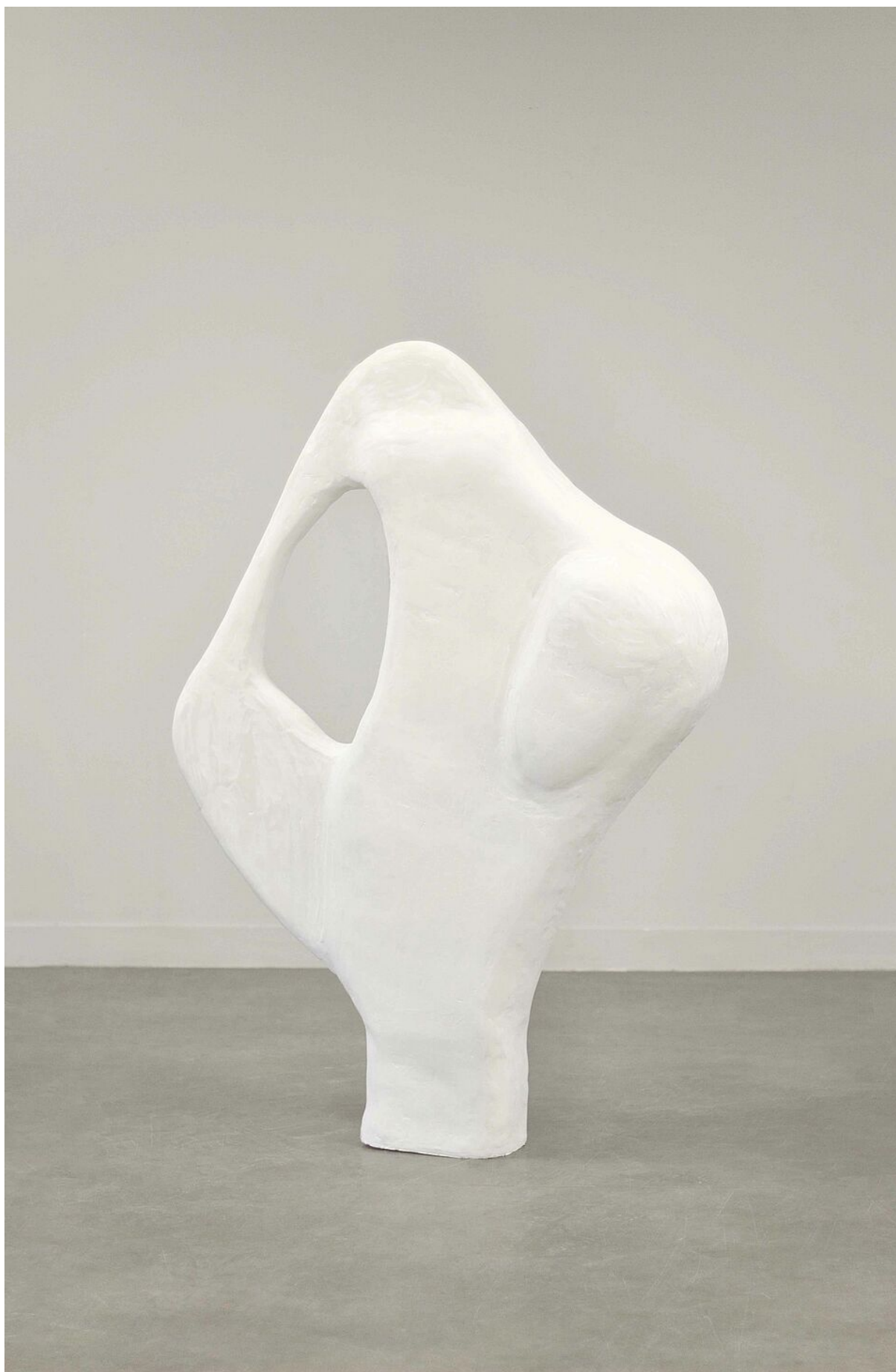
Œuvre d'Emma Savary