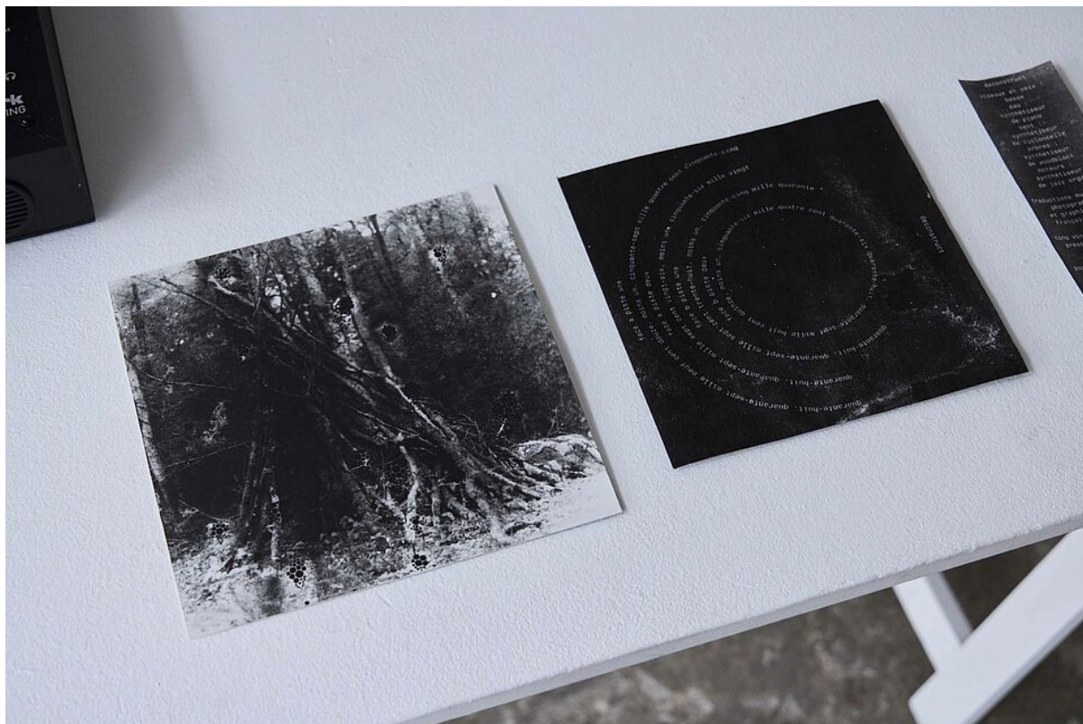
Œuvre de François Chemin