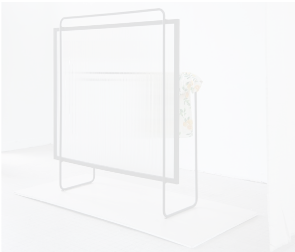
Œuvre de Romane Subtil