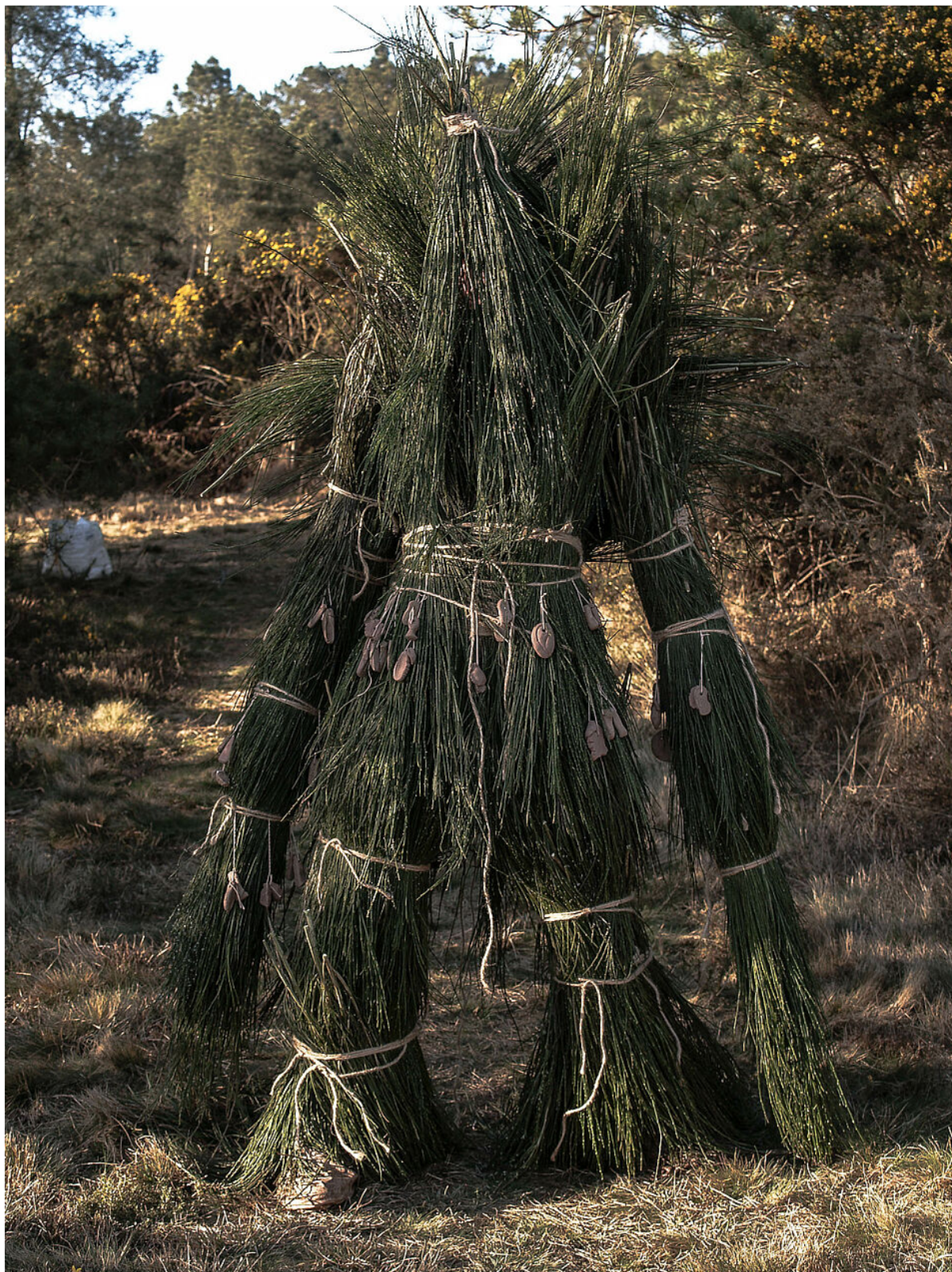
Costume de performance de Mérovée Dubois