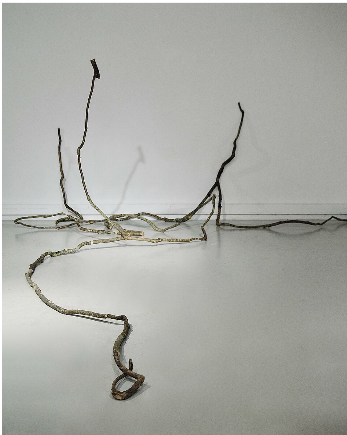
Œuvre de Kim Legal