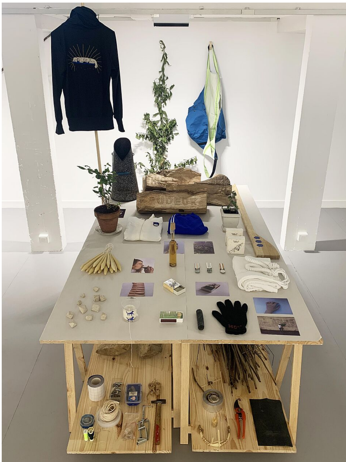
Œuvre de Marie Delaite