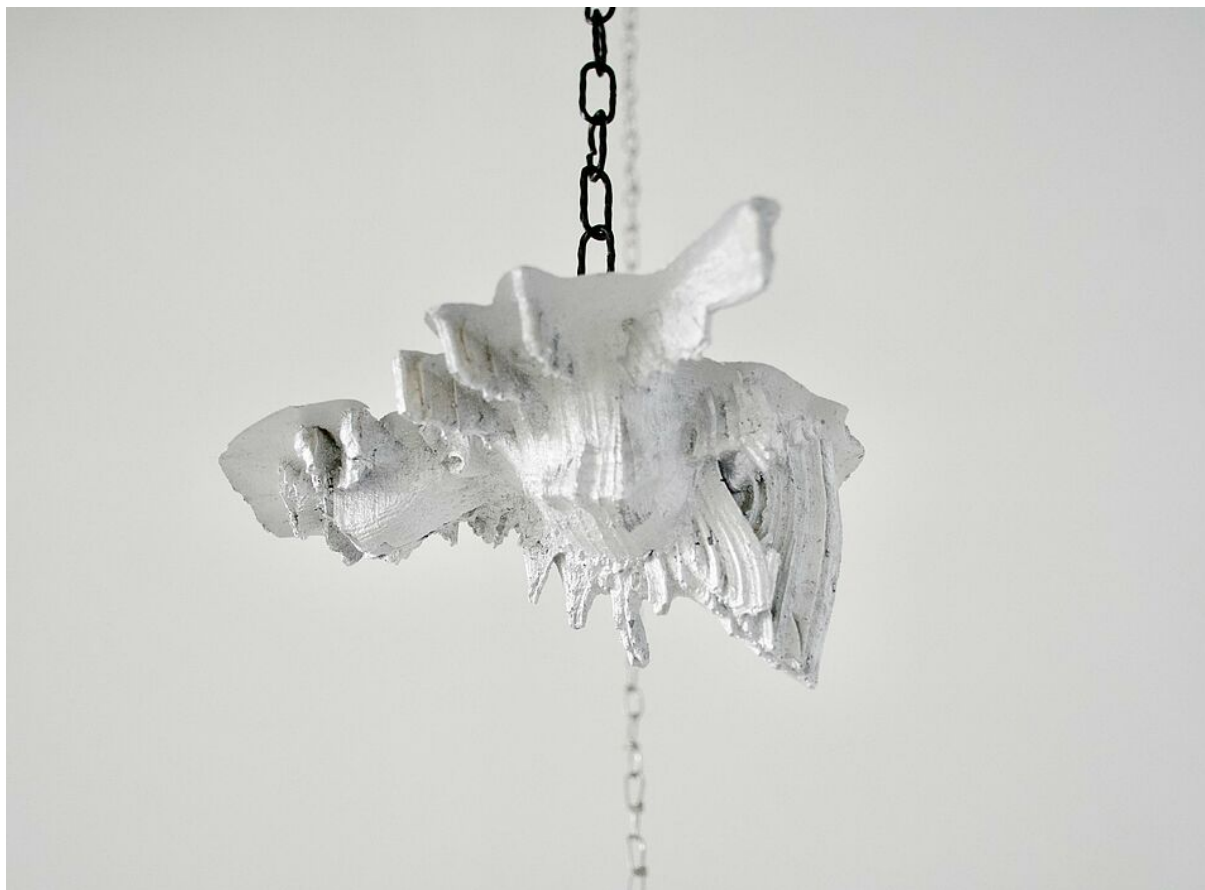
Œuvre de Maldon Guihard