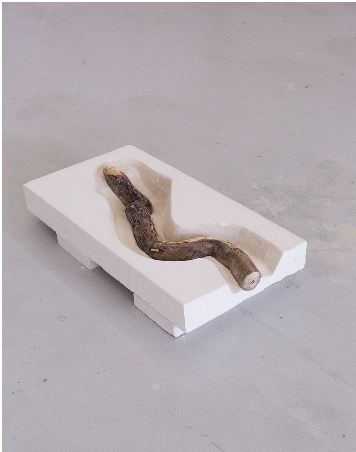
Œuvre d'Eva Bernard