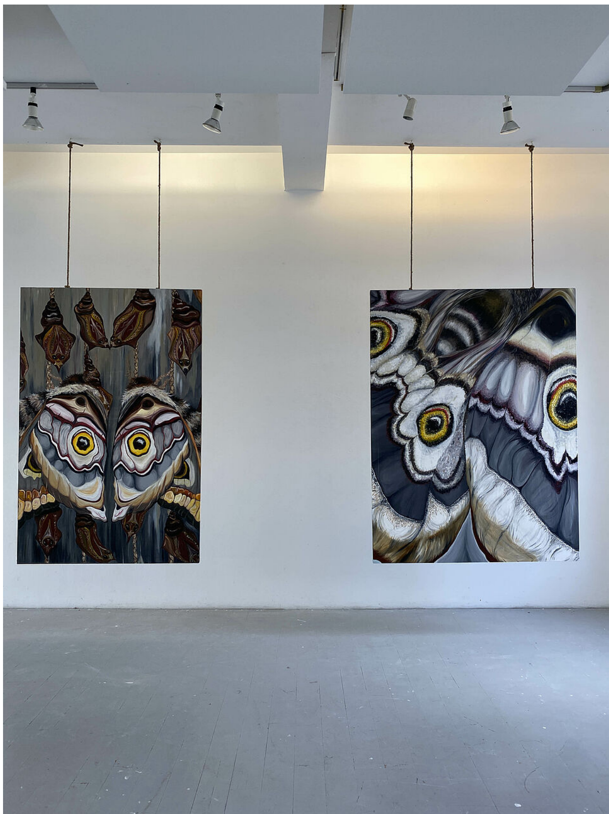
Œuvre de Juliette Prioult