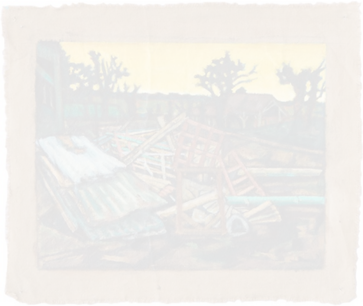
Œuvre d'Alix Cantelaube