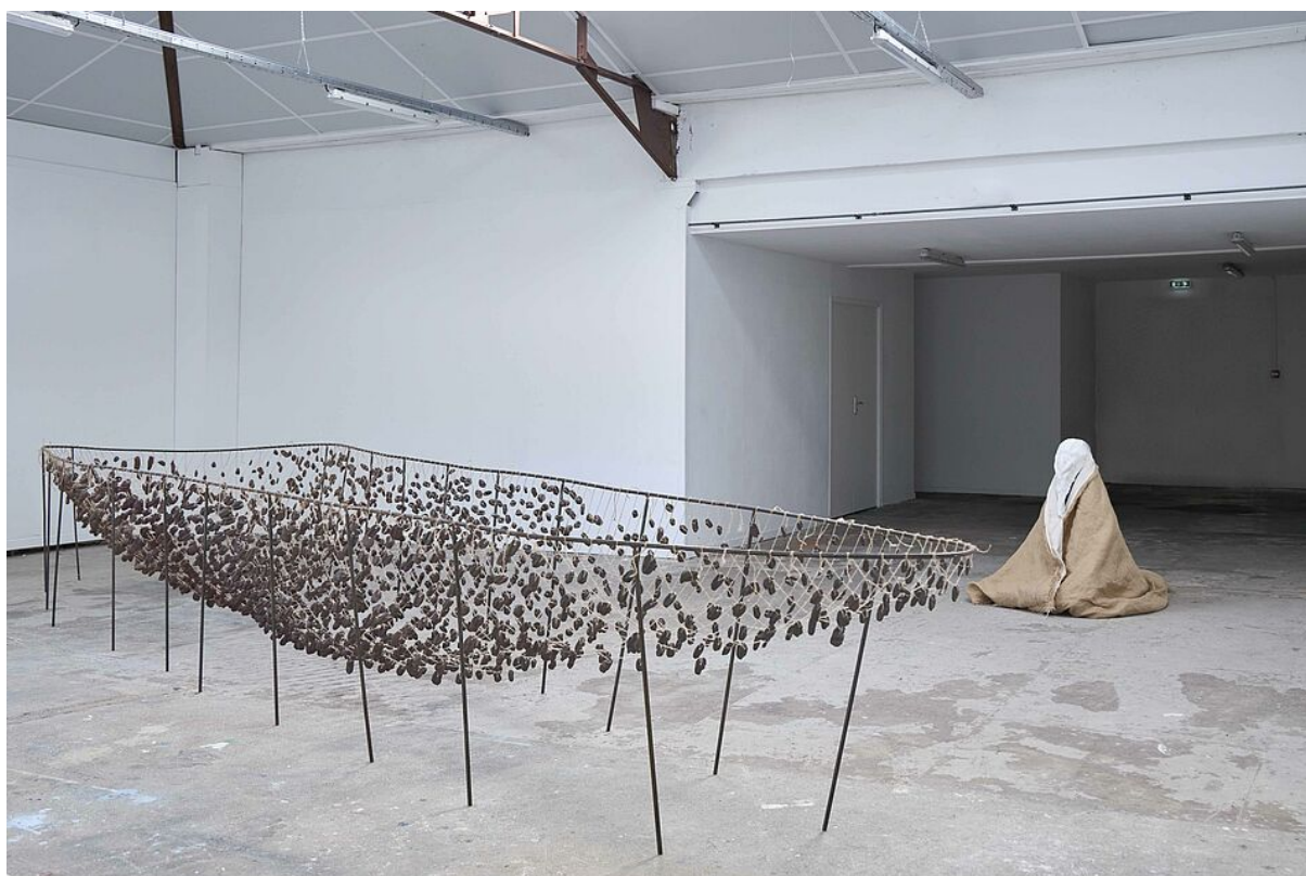
Œuvre collective de Mérovée Dubois et Cordina, et œuvre de Cordina en arrière-plan