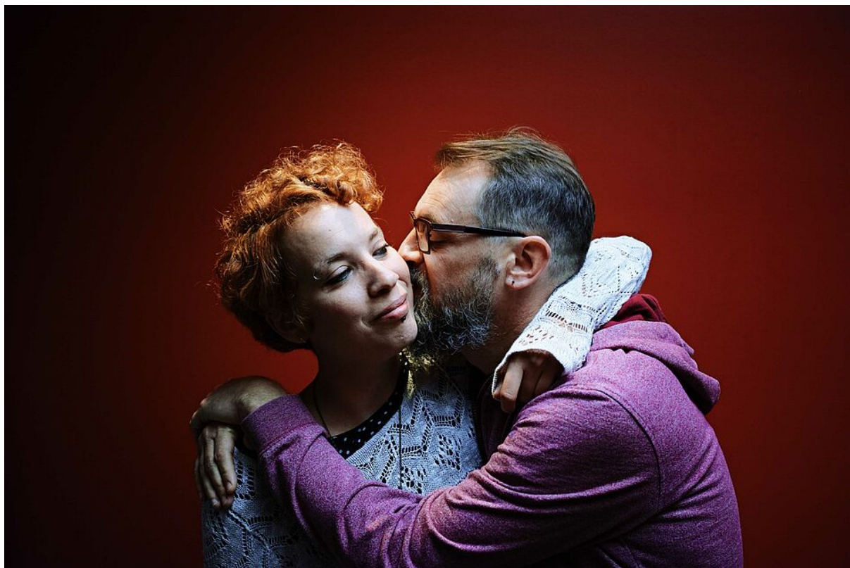
Fools in love.

En partenariat avec L'Echonova – Lieu de musiques actuelles