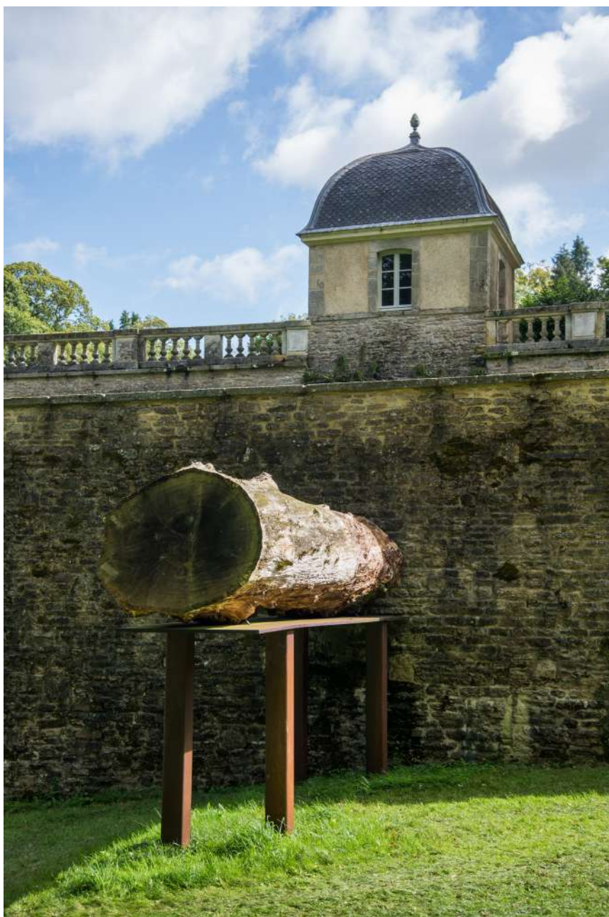
Roland Cognet, Chêne , 2014 – Domaine de Kerguéhennec

LEVI VAN VELUW ROLAND COGNET MARC COUTURIER TAL COAT / EDMOND QUINCHE GUILLAUME BABIN EDOUARD SAUTAI