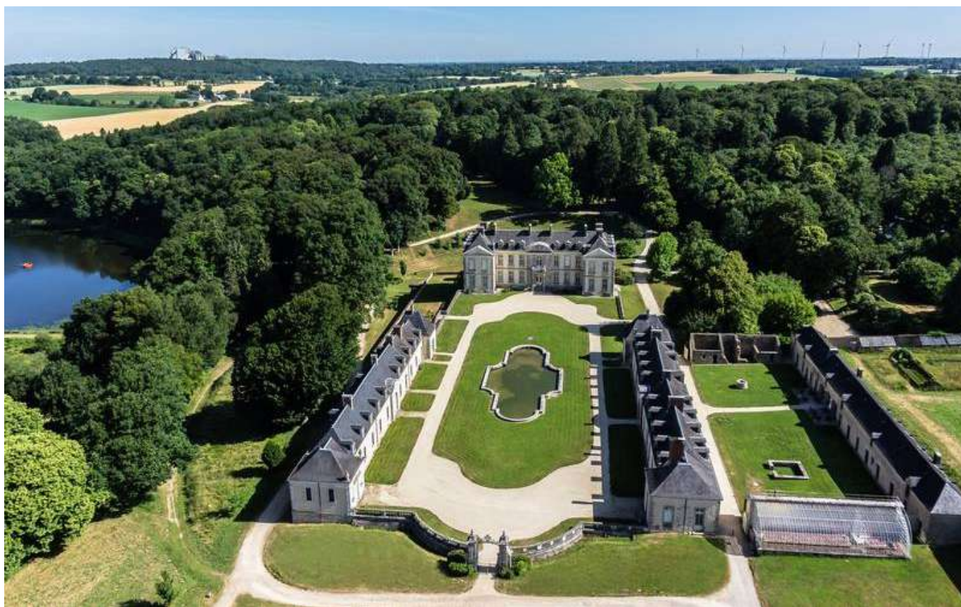
Domaine départemental de Kerguéhennec

Le Domaine de Kerguéhennec a été acquis par le Département du Morbihan en 1972 et classé au titre des monuments historiques en 1988, il fait partie du réseau européen des Centres culturels de rencontre, lieux de patrimoine dédiés à des projets de recherche et création transdisciplinaires, tissant un lien étroit entre des publics variés et partageant une implication forte dans le développement de leurs territoires.