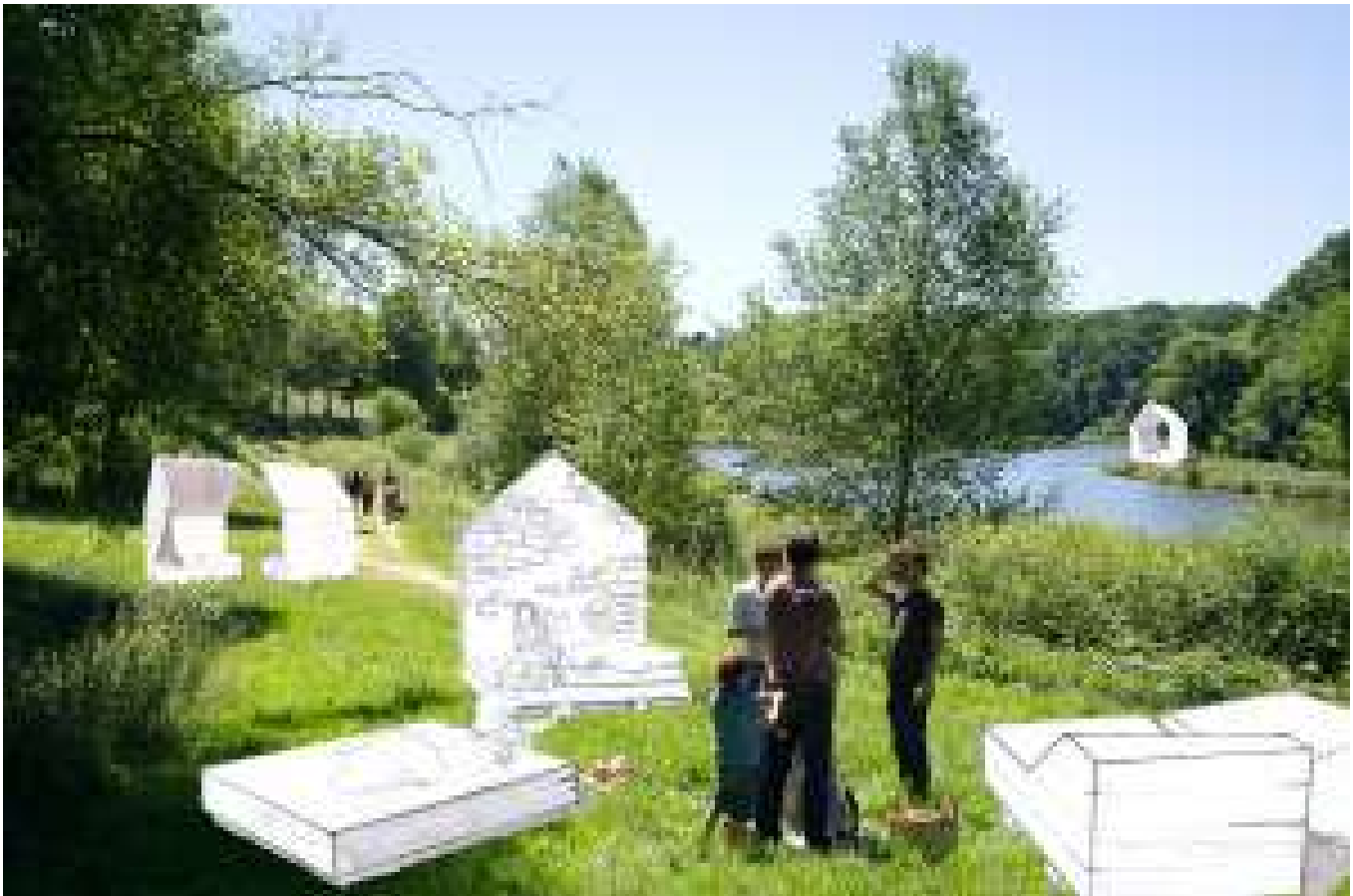
Simulation des « repères » de Guillaume Babin dans le parc de Kerguéhennec

Au terme d'une longue réflexion, menée en collaboration avec Louis Michel Nourry, historien du paysage et des jardins, et Michel Collin, paysagiste-concepteur, un nouveau plan de gestion et d'aménagement du parc a été élaboré qui renoue avec l'esprit du dessein originel et révèle des perspectives enfouies sous la végétation... Deux artistes, Guillaume Babin (né en 1989. Vit et travaille à Paris), en résidence de janvier à juin 2017, et Edouard Sautai (né en 1965. Vit et travaille à Paris), en résidence d'avril à juin 2018, produiront des dispositifs de lecture et d'appréhension du paysage en s'interrogeant sur les usages du parc par ses visiteurs.