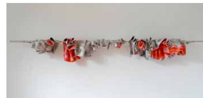
Accumulation de cinq peintures sur barre, 2013