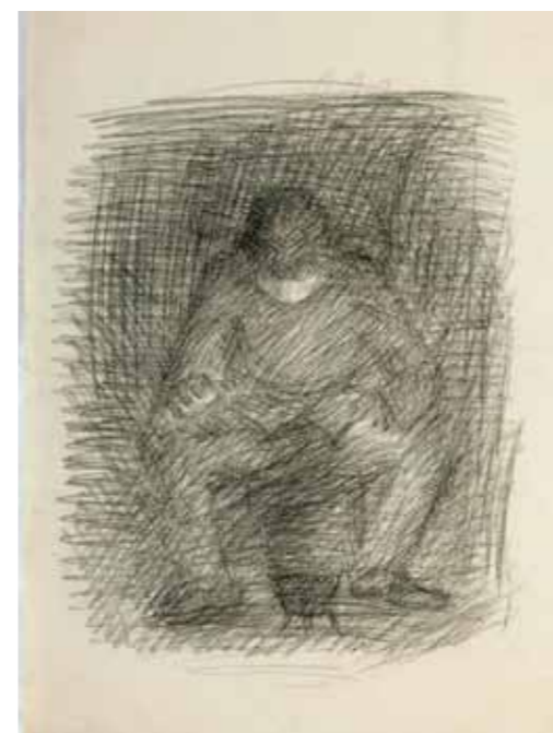
Le Brasero, 1926.