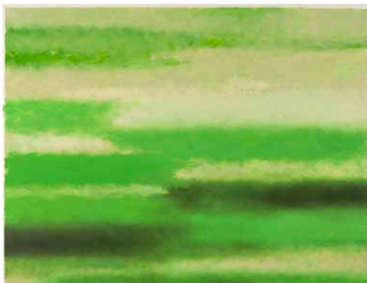
Jacques Le Brusq, Eaux montantes , 2010, huile sur papier, 48 x 63 cm