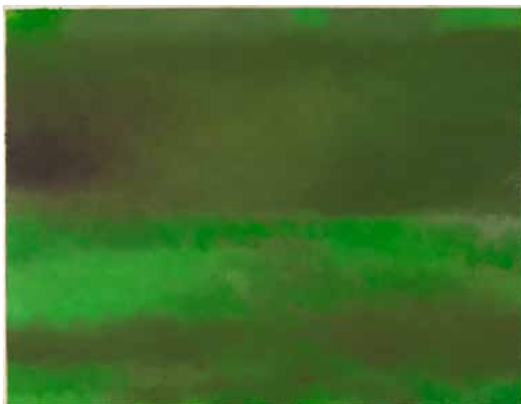
Jacques Le Brusq, Paysage , 2012, huile sur papier, 48 x 63 cm