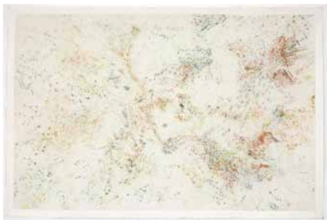
Jean-Jacques Dournon, Territoire 3 , 2012, acrylique, pastel sec et fusain sur papier, 102 x 152,8 cm Photo Stéphane Cuisset / ADAGP, Paris 2013