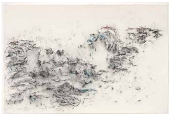
Jean-Jacques Dournon, En revenant de Callot par les Abers , 2011, pastel sec et fusain sur papier, 102 x 153 cm

www.galerieditesheim.ch / www.lecoindesarts.com