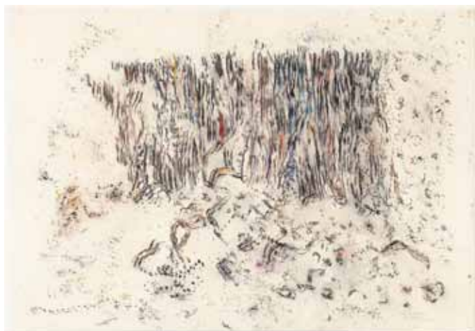
Jean-Jacques Dournon, Elle, la falaise , 2012, pastel sec et fusain sur papier, 80 x 114,5 cm