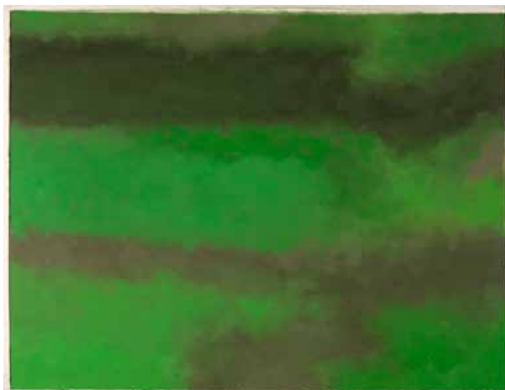
Jacques Le Brusq, Paysage , 2012, huile sur papier, 48 x 63 cm