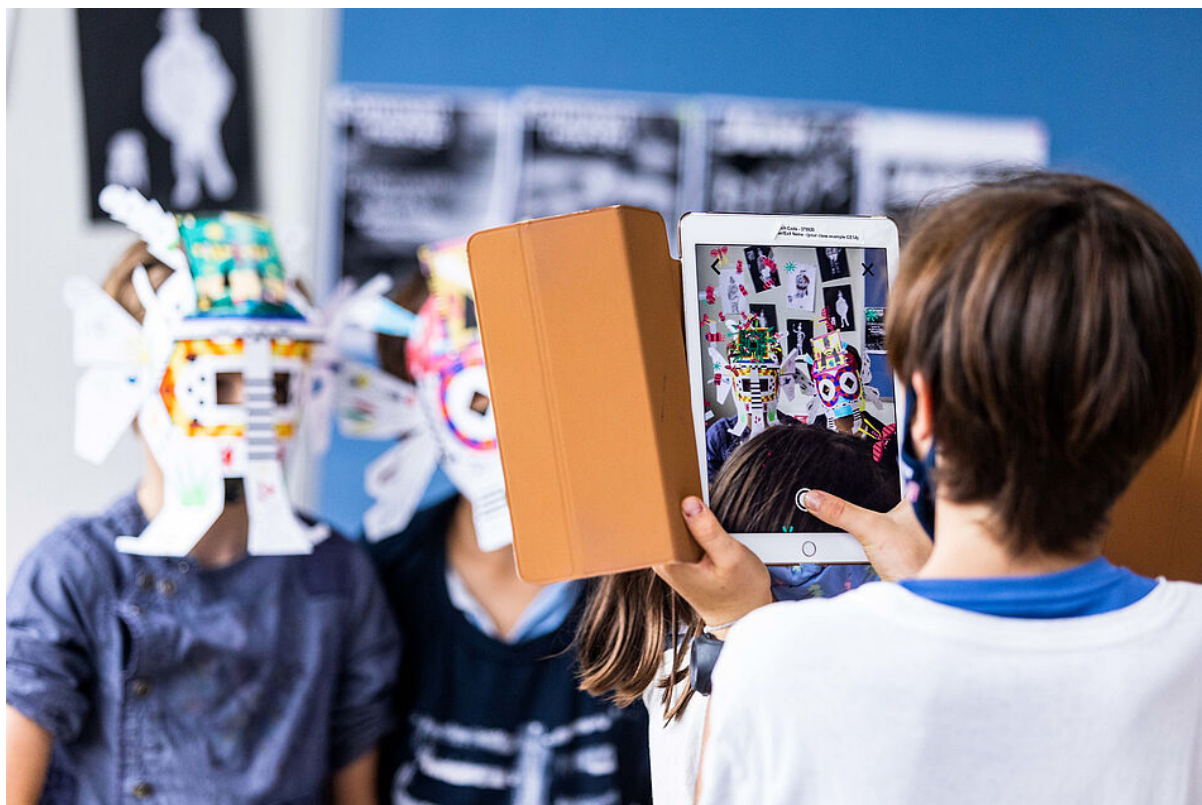
Atelier masques augmentés.

Pour terminer cette journée, Radio Minus propose une boum cosmopolite pour les enfants et leurs parents. Les artistes Sylvain Quément et Yassine de Vos, collectionneurs de disques vinyles, se proposent de révéler les trésors cachés de la musique conçue par et pour les enfants. Pas question de leur faire entendre les morceaux qu'ils connaissent déjà. Puisant dans sa discothèque d'enregistrements rares, la station diffuse les titres les plus inattendus et inclassables. Des compositions de tous pays, styles et époques sont à découvrir lors d'une session de DJ set et ponctuée de chorégraphies et jeux interactifs. Ce spectacle est produit par Armada Productions, en partenariat avec Capitaine Futur/La Gaîté Lyrique et Stereolux.