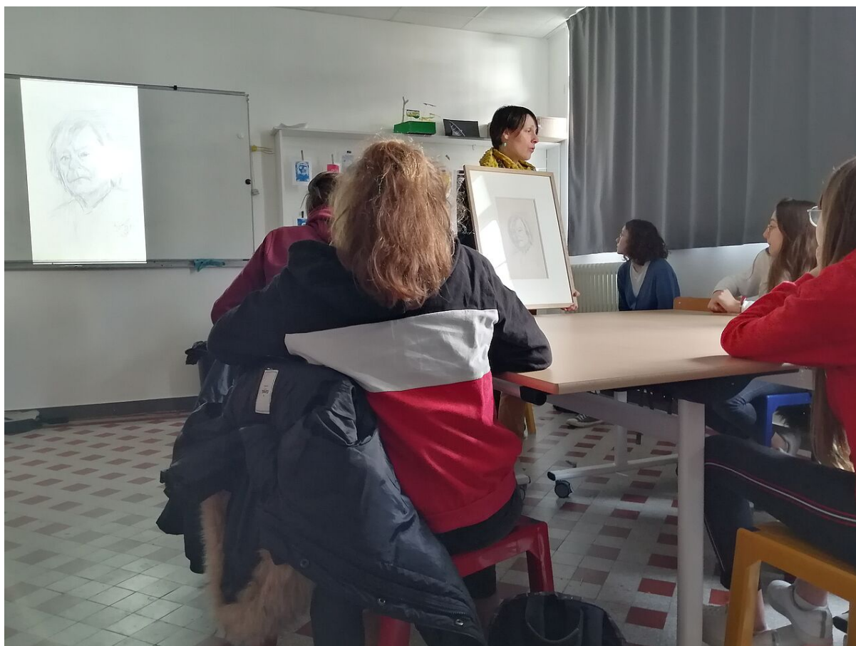
Présentation d'un autoportrait dessiné de Tal Coat.