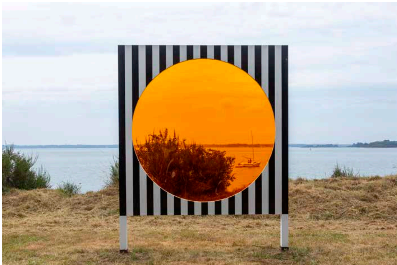
© Photo-souvenir: Daniel Buren, "Au détour des routes et des chemins, 7 travaux in situ", 2022 – Bilhervé, Ile d'Arz © Daniel Buren, ADAGP, Paris