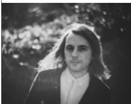
Le Comte © Jean Sylvain Le Gouic