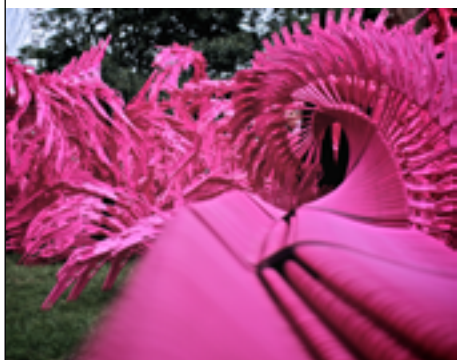
BloomGames5 © JoseSanchez