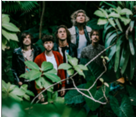
Cabaret contemporain