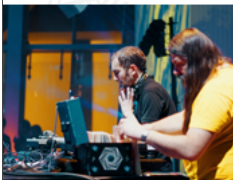
Radio Minus