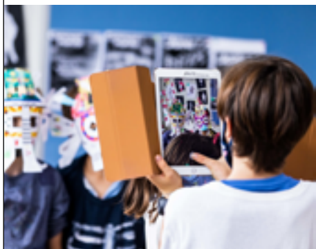
Atelier masques augmentés

Pour terminer cette journée, Radio Minus propose une boum cosmopolite pour les enfants et leurs parents. Les artistes Sylvain Quément et Yassine de Vos, collectionneurs de disques vinyles, se proposent de révéler les trésors cachés de la musique conçue par et pour les enfants. Pas question de leur faire entendre les morceaux qu'ils connaissent déjà. Puisant dans sa discothèque d'enregistrements rares, la station diffuse les titres les plus inattendus et inclassables. Des compositions de tous pays, styles et époques sont à découvrir lors d'une session de DJ set et ponctuée de chorégraphies et jeux interactifs. Ce spectacle est produit par Armada Productions, en partenariat avec Capitaine Futur/La Gâité Lyrique et Stereolux.