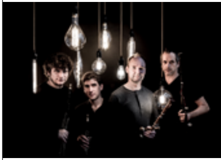
SONNEURS-004 © Atelier_Marge_Design