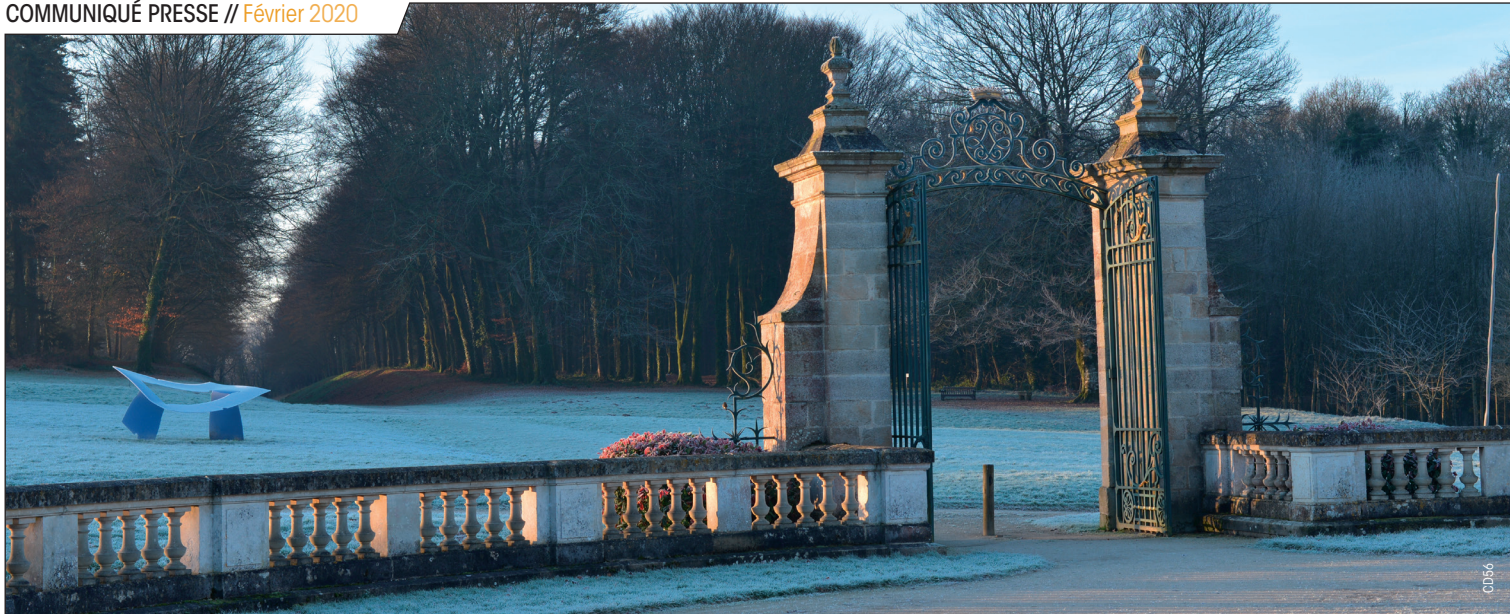
Parc du domaine de Kerguéhenec