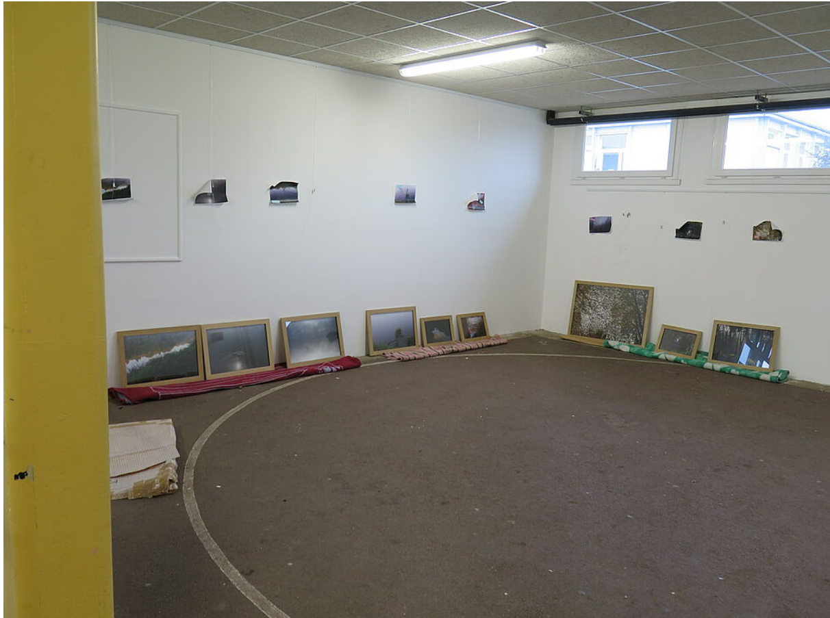
Accrochage des œuvres de Franck Gérard dans le cadre de l'exposition itinérante "Figure(s) et paysage" à l'école Joliot Curie - Lanester, en 2015.

Durée : 1 séance d'une demi-journée (2 H) Niveau : à partir de 9/10 ans Tarif : 120€ / séance