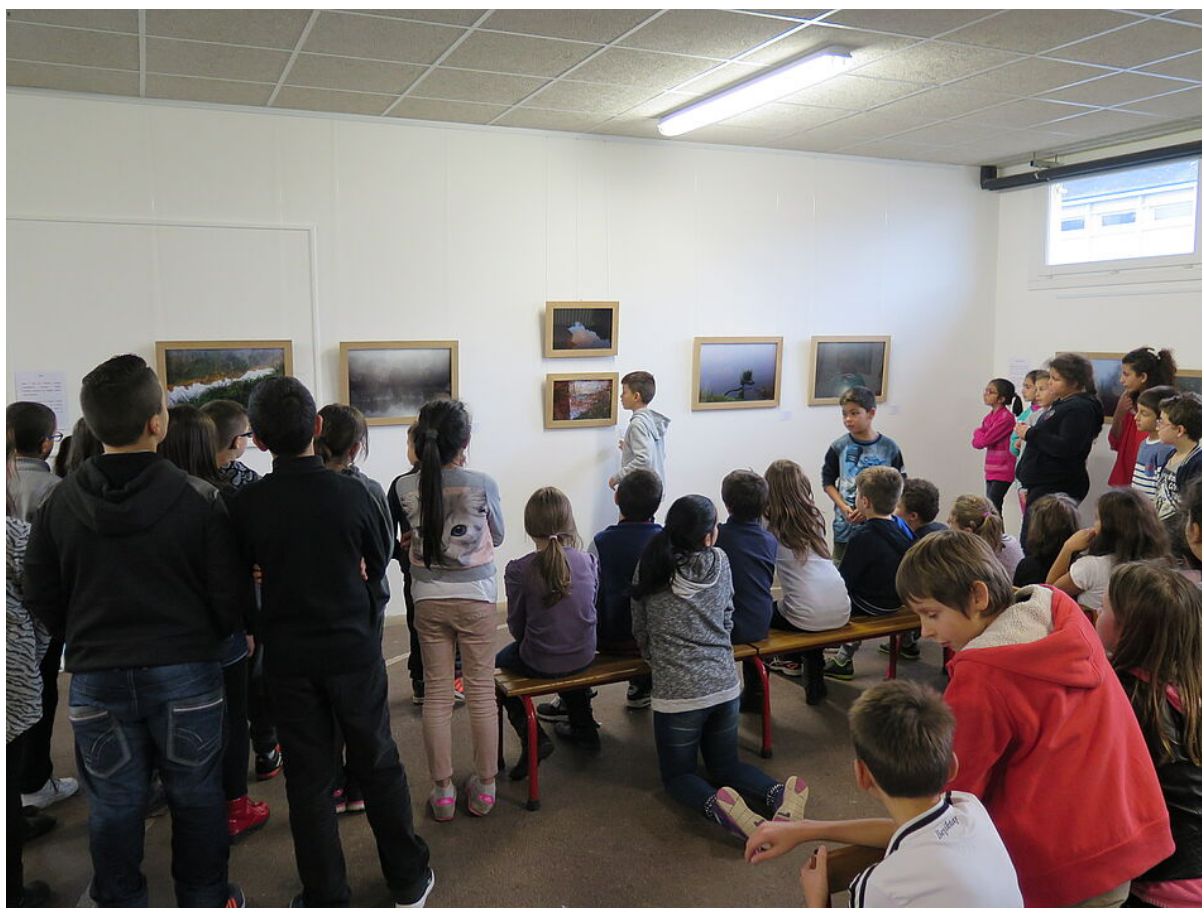
Inauguration de l'exposition itinérante "Figure(s) et paysage" à l'école Joliot Curie - Lanester, en 2015.