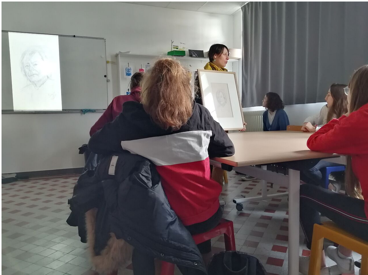
Présentation d'un autoportrait dessiné de Tal Coat.