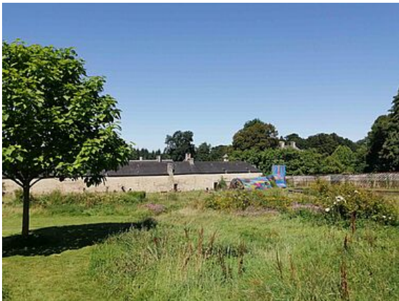
Le potager en 2021.

Vaste espace d'un hectare, protégé par ses hauts murs et ses accès détournés, l'ancien potager a été aménagé au 19e siècle.